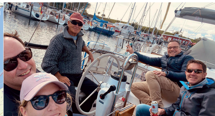
Die glückliche Premiere-Crew beim Anlegebier im Yachthafen Grömitz. Gute Laune pur.